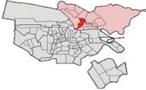
FIGUUR 2. KAART VAN VOLEWIJCK, 2012

Legenda Lichtrood: Stadsdeel Amsterdam-Noord Felrood: Wijk 60 Volewijck