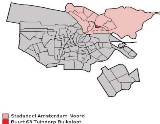
FIGUUR 1. KAART MET LOCATIE VAN TUINDORP BUIKSLOOT, 2012

Legenda Lichtrood: Stadsdeel Amsterdam-Noord Felrood: Wijk 63, Tuindorp Buiksloot