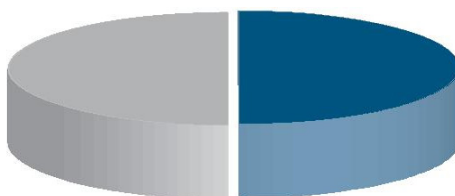
Figura 1. Ndarja rurale/urbane (% e totalit të popullsisë) Urbane 53.7% Rurale 46.3%

Burimi: INSTAT, Të Dhëna Paraprake të Regjistrimit të Popullsisë 2011.