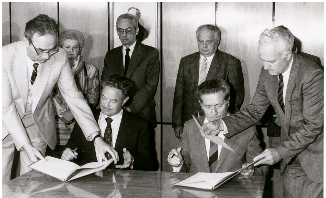
Soros György a magyarországi alapítvány alapító dokumentumait írja alá, 1984

1984-ben Magyarországon egypártrendszer volt a kommunista párt irányításával, amely ugyanakkor már a szabad piacgazdasággal kapcsolatos reformokkal kacérkodott. Sorosnak meggyőződése volt, hogy a kommunista rendszer kudarcra van ítélve, és azt a célt tűzte ki, hogy segíti Magyarország fölkészülését a demokratikus átmenetre. Az alapítvány 2007-ig Soros Alapítvány néven volt ismert, és a kezdetekben az volt a célja, hogy felkutasson és anyagilag támogasson olyan reform gondolkodású szervezeteket, amelyek részvételi módon szerveződtek a közvetlen pártellenőrzést kikerülve, mint például az egyetemi hallgatók önkormányzati fórumai.