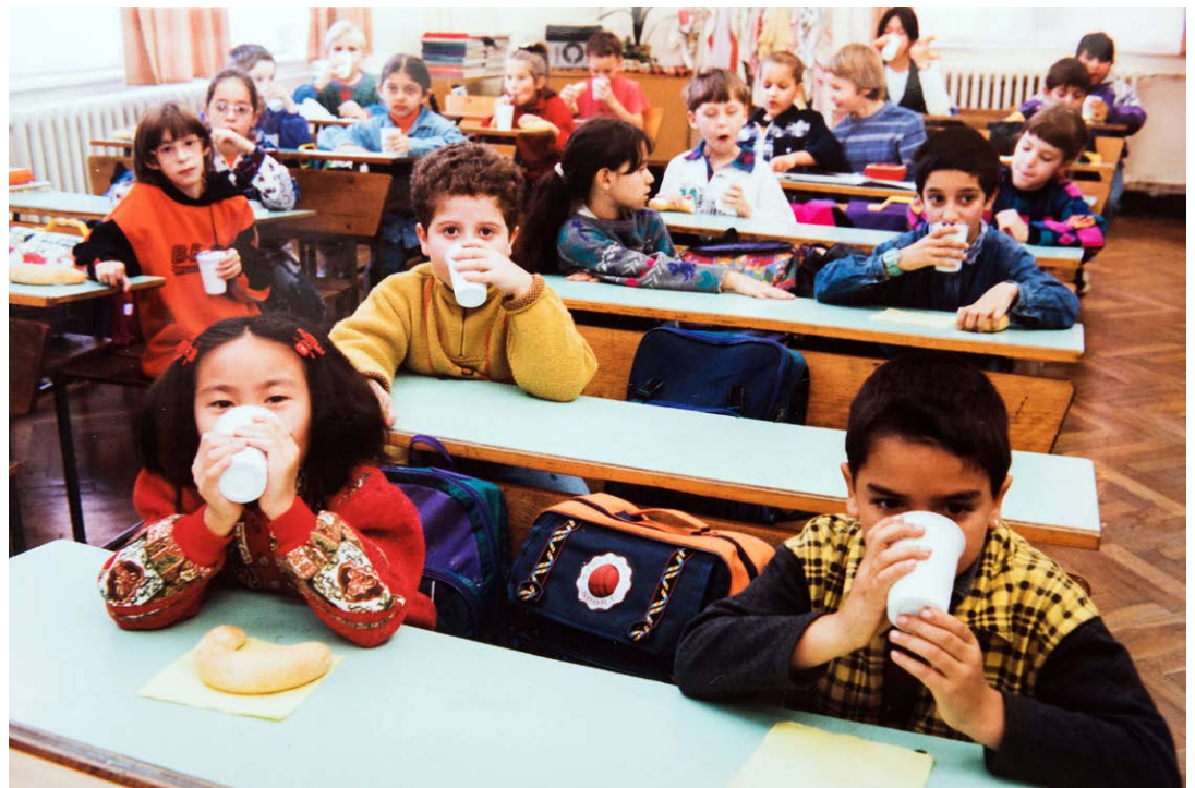
Az iskolatej programban résztvevő gyermekek, 1991

Soros, aki maga is végigszenvedte a háborús idők inséges éveit, nagyon jól tudta, hogy az átmeneti időszak nagyon nehéz. Ezért 1991-ben az alapítványa segített kidolgozni és megvalósítani egy nagyon sikeres új iskolatej-programot, amelynek keretében Budapest minden iskolájának tanulói naponta egy pohár tejet és péksüteményt kaptak reggelire.